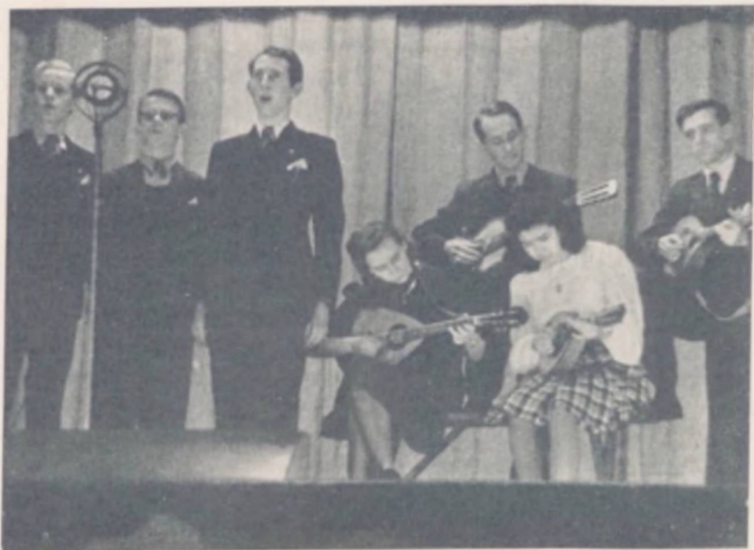
»Vi kan selv!»

lige Midler til Raadighed — maa man naa dertil, at Adgangen til den højere Uddannelse alene gøres afhængig af Elevernes Evner og Flid og ikke af Forældrenes økonomiske Kaar.