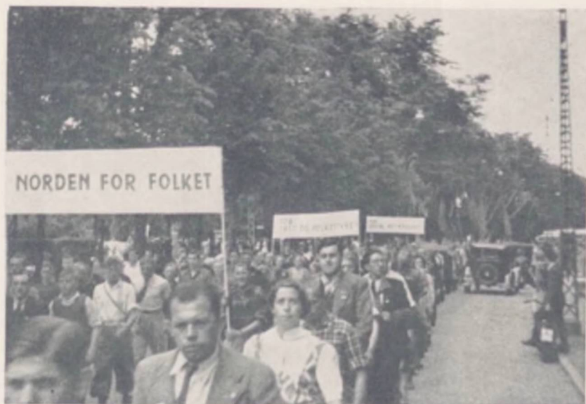
Ungdommen bekender sig til Norden

Uden at ove Uret til nogen Side kan det sikkert fastslaas, at det er Sverige og Danmark, der har været Rygraden i dette nordiske Samarbejde, og det var ogsaa Repræsentanter for disse to Lande, der i Midten af 30'erne fik udjævnet nogle Vanskeligheder omkring det norske Ungdomsforbund, saaledes at dette førtes tilbage til Samarbejdet samtidig med, at der foretoges Ændringer i Reglerne for dette.