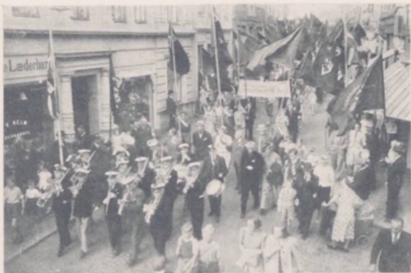
D. a. U.-Stævne i Holstebro

Under Behandlingen i Folketinget ændredes Forslaget paa en Række Punkter; men videregaaende Ændringsforslag fra Venstre og de Konservatives Side forkastedes, og disse Partier stemte desaaarsag ved 3. Behandling imod Loven. I Lobet af to Dage ekspederede Landstinget Forslaget, og den 7. Maj 1937 stadfæstedes Loven.