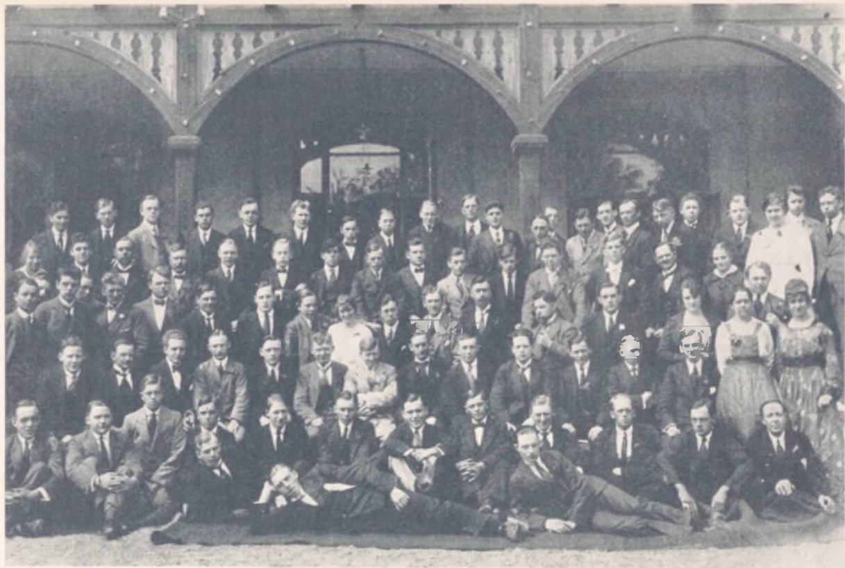
Delegerede og Gæster paa Nyborg-Kongressen 1920