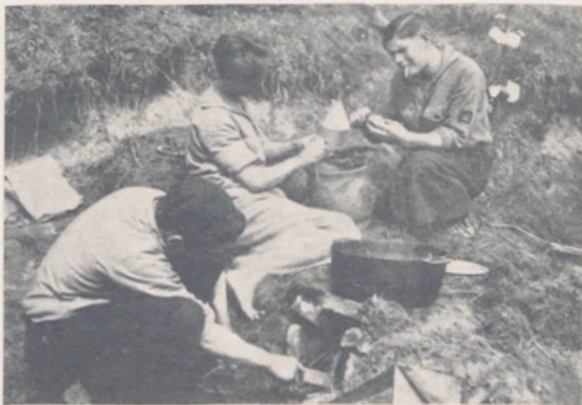
Madlavning i Lejren

under den Madsen-Mygdal'ske Regerings unodigt haardhændede Nedskæringspolitik, og man oplevede (i 1929) denne Regerings Fald og Dannelsen af det andet Ministerium Stauning; vi havde to Folketingsvalg, et Landstingsvalg og en Folkeafstemning i 1920, Folketings- og Landstingsvalg i 1924, Folketingsvalg i 1926, Landstingsvalg i 1928 og Folketingsvalg i 1929.