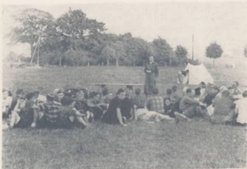
Foredrag i Landslejren

toges Arbejdet for Rejsning af en Lederhøjskole op; men denne Tankes Realisering har man dog foreløbig maattet udskyde.