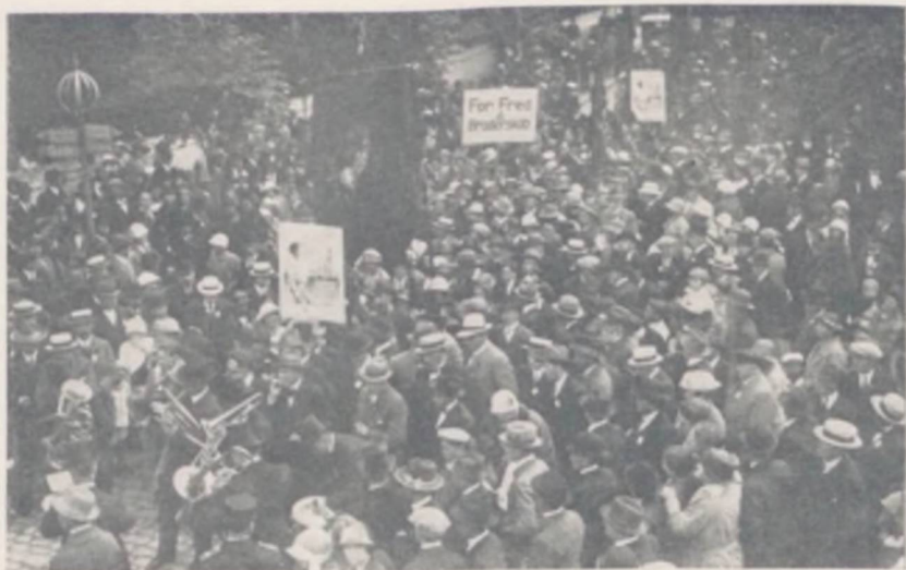
Fra det internationale Ungdomsstævne i Aarhus 1924

at Udveksling af Talere finder Sted, dels i agitatorisk Øjemed og dels for Udbredelse af Kendskab til de tilsluttede Ungdomsforbund;