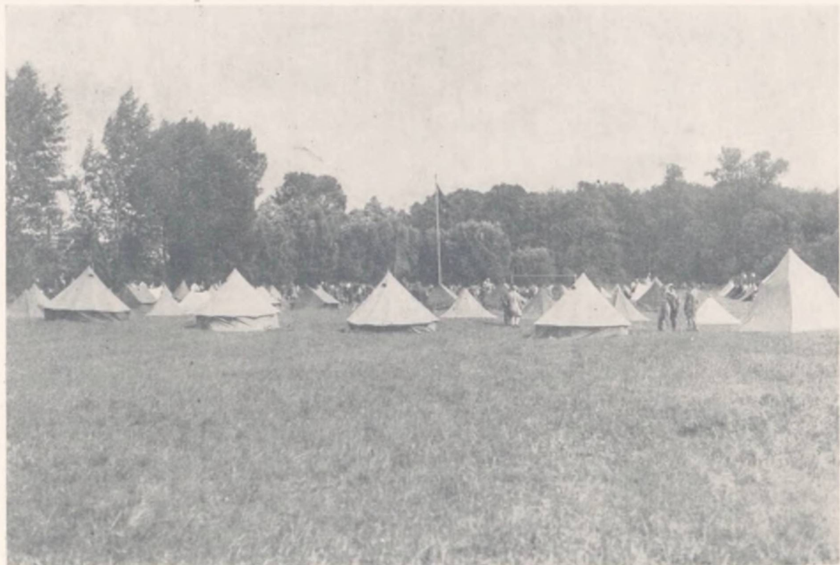
D. s. U. ere har slaæet de hvide Telte op og hejst den røde Fane over Lejren