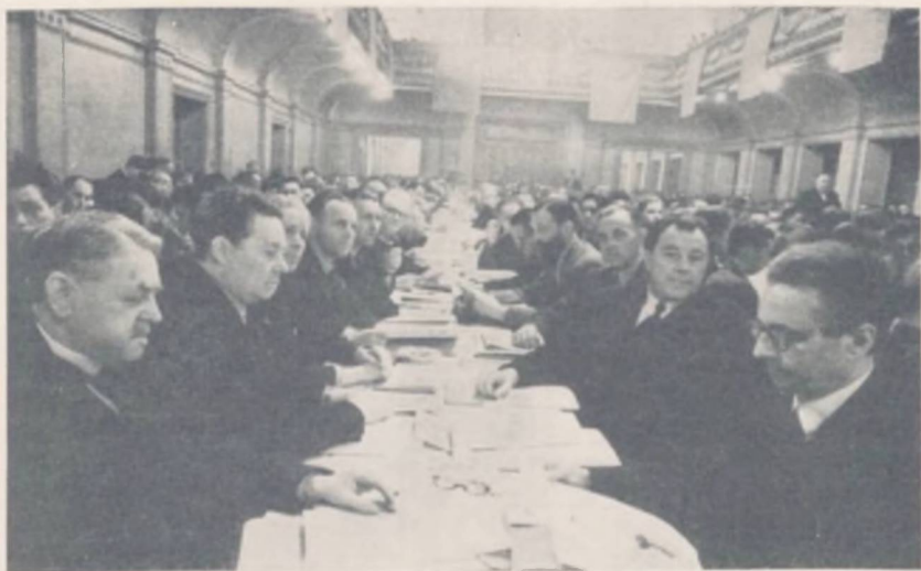
Fra Gæstebordet ved Kongressen i København 1943

deles mærkbare Indgreb og Ændringer i det daglige Liv skabte Hindringer af en uanet Karakter og et hidtil ukendt Omfang.