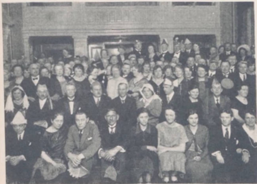
«Gammelmands-Fest i Aarhus