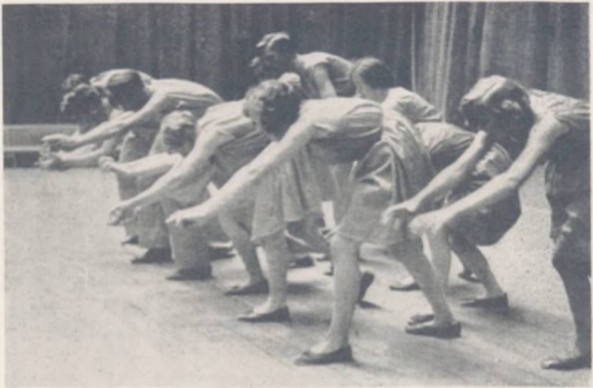
Scene fra et Talekor