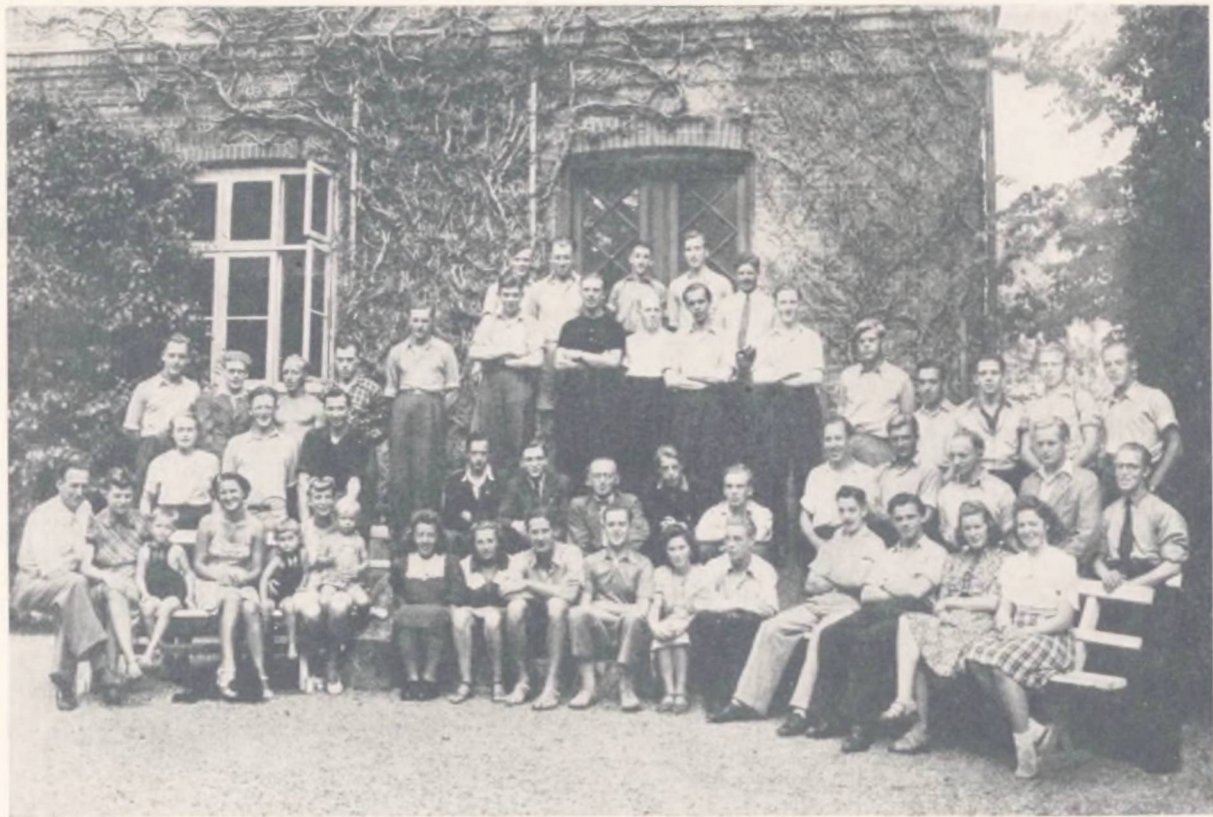
Landslederkursuset paa Kraglund August 1944