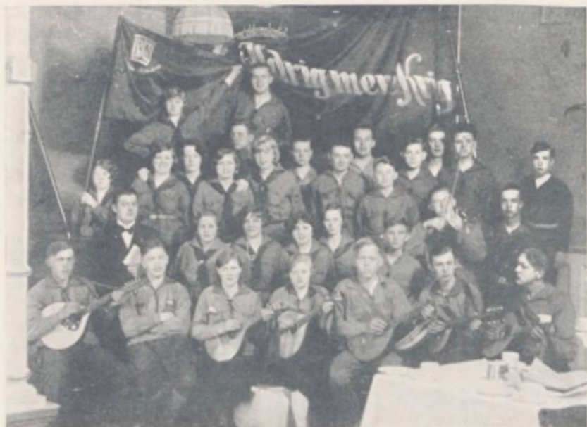
Talekor ved Faneindvielse

»De Høje Kontraherende Parter erklærer højtideligt i deres respektive Folks Navn, at de fordømmer Tilflugt til Krig til Løsning af mellemfolkelige Uoverensstemmelser og giver i deres indbyrdes Forhold Afkald paa Krigen som et Redskab for national Politik.«