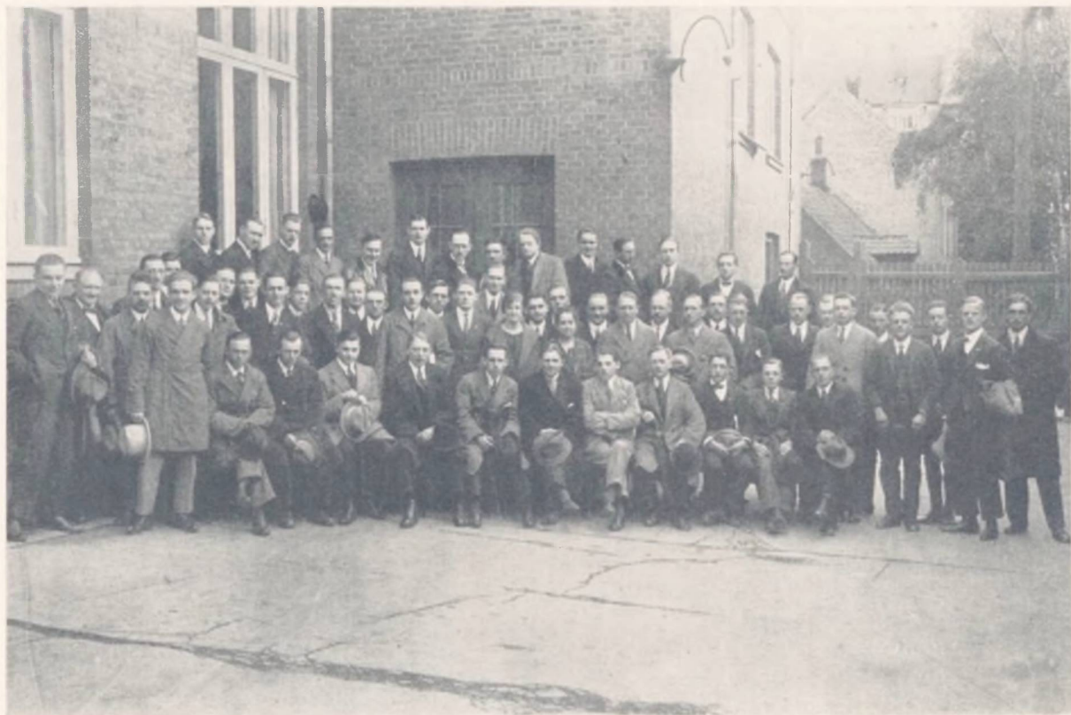
Under en Pause i det første Studiekredsleder-Kursus i Aarhus, September 1923