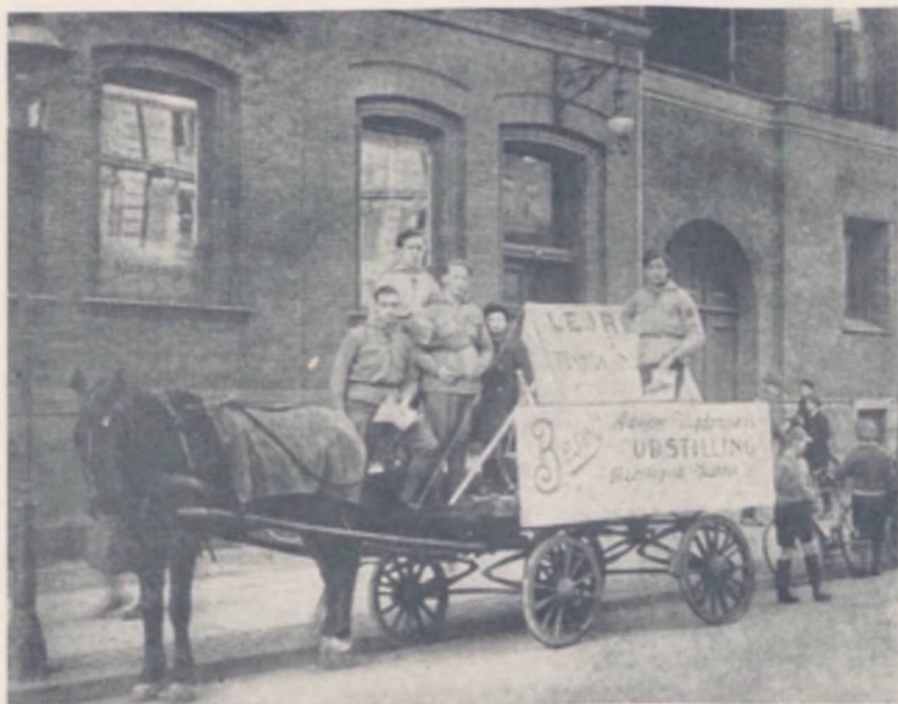
Reklame for Arbejderungdommens Udstilling paa Teknologisk Institut i Forblindelse med det nordiske socialistiske Ungdomstævne i København Juli 1930

holdt i Norden, og at den Procession, der i Gaar gik fra Grøntorvet, er den største og flotteste Ungdoms-Demonstration, København nogensinde har set«.