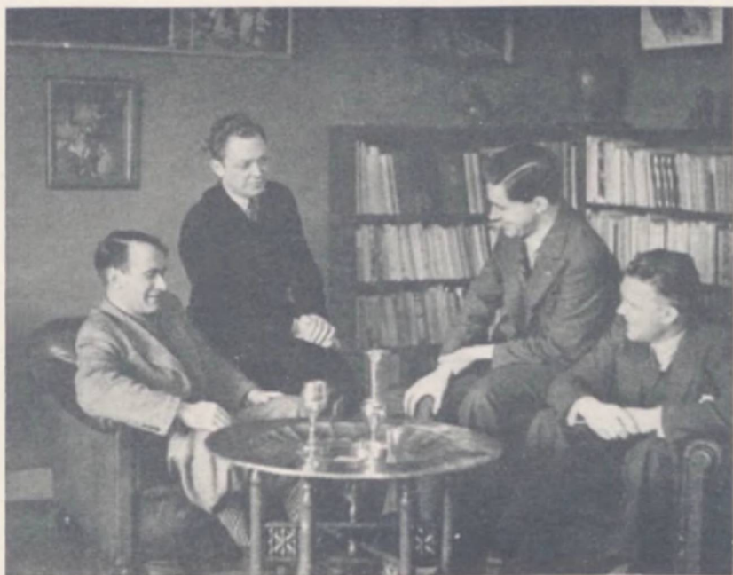
Lille, hyggelig nordisk Komsammen. Fra venstre: Trygve M. Bratteli, Norge, Torsten Nilsson, Sverige, Poul Hansen, Danmark, og Adolf Wallentheim, Sverige

overvældende Flertal, fandtes følgende Afsnit, der vakte stor Opmærksomhed i Offentligheden: