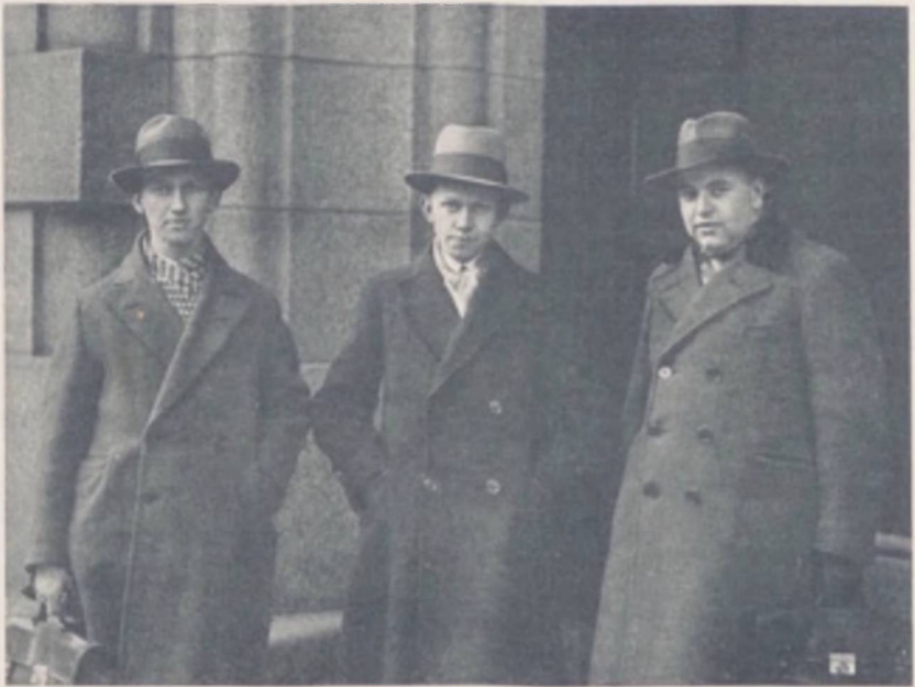
En D. s. U.-Deputation i 1932, fotograferet paa Rigsdagens Trappe, efter at den har overleveret Socialminister Steincke en Redegørelse for Lærlingeungdommens Hovedkrav til Lovgivningen.