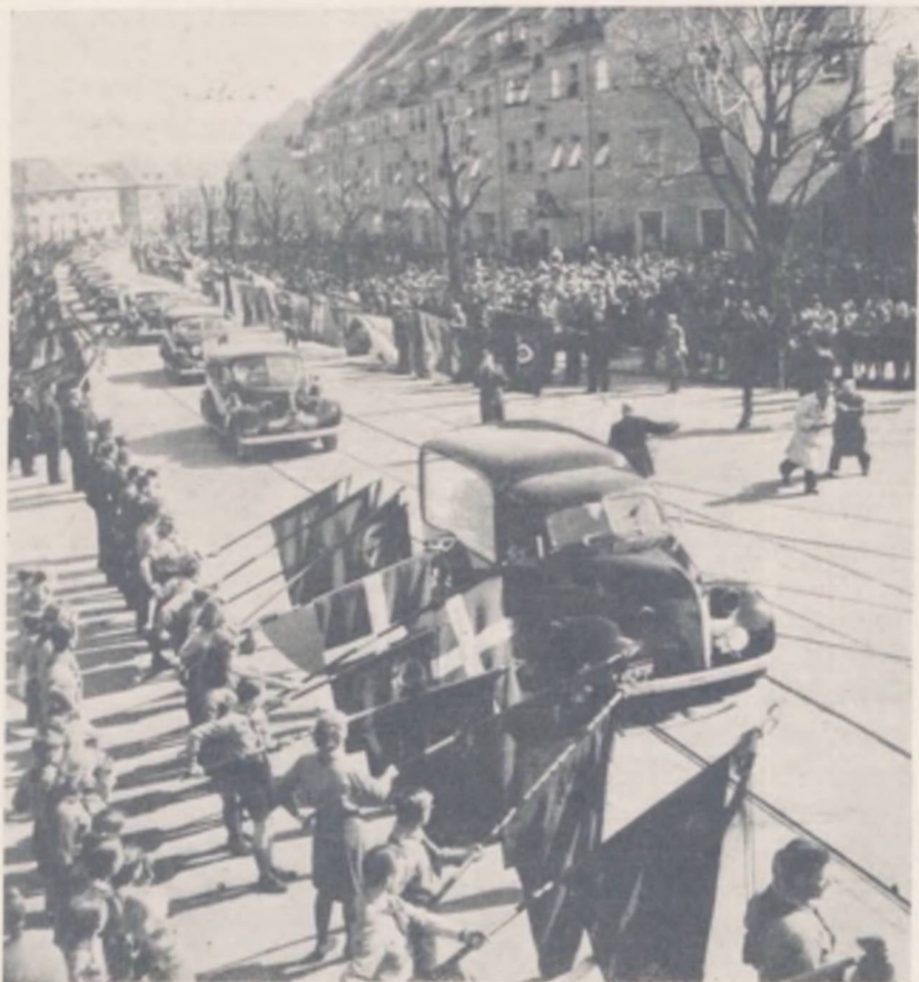
D. s. U. s sidste Hilsen til Stauning, da Baaren føres til Bispebjerg Krematorium, Maj 1942

arbejdet betydet en haardt tiltrængt Udvidelse af Horisonten og for de upolitiske en Forstaaelse af, at Samfundsspørgsmaal kommer ingen vaagen Ungdom uden om.