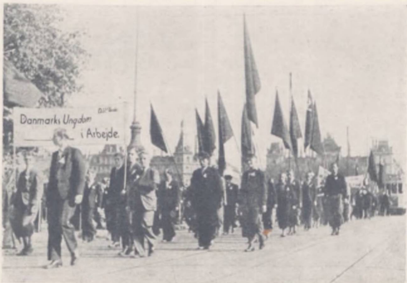
For Beskæftigelse til Ungdommen

De sidste Aartiers og ganske særlig den allerseneste Tids Udvikling har paa afgørende Maade ændret Ungdommens Stilling i Samfundet. Mens der tidligere kun i ringe Grad fandtes et egentligt Ungdomsproblem, er det modsatte Tilfældet nu. De hidtidige sædvanebestemte Former for Ungdommens Opdragelse, Uddannelse og Indføring i Erhvervslivet er enten slaaet i Stykker eller har vist sig utilstrækkelige. Det forcerede Arbejdsliv og Rationaliseringen stiller større Krav. Arbejdsomraader, der ikke byder Ungdommen egentlige Uddannelsesmuligheder, er opstaaet gennem de talrige Pladser som Bude, Avisdrengene o. l. Inden for visse Arbejdsgrene, bl. a. Landbruget og ved Husgerning, bydes der materielt saa utilfredsstillende Vilkaar og aabner sig saa mørke Fremtidsudsigter, at man endog har talt om Mangel paa Arbejds-kraft. For Landbrugets Vedkommende har ganske særlig Kriseperioden bidraget hertil, idet den har affødt en Tendens til fortrinsvis at anvende den alleryngste Arbejds-kraft, der dog naturligvis kun er til Stede i begrænset Omfang. Dette har igen medført et haardere Pres paa disse helt unge Medhjælpere. Den rivende tekniske Udvikling af de kulturelle Meddelelsesmidler (Film, Radio, Presse osv.) har placeret Ungdommen i en Trommeild af de forskelligste kulturelle Paavirkninger, uden at der samtidig er givet den væsentligt øgede Muligheder for en Vurdering heraf.