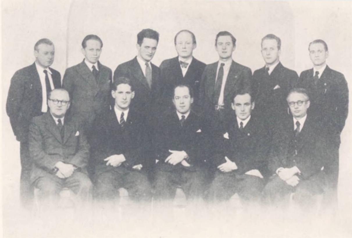
D. s. U. s Sekretariat ved 25 Aars Jubilæet.