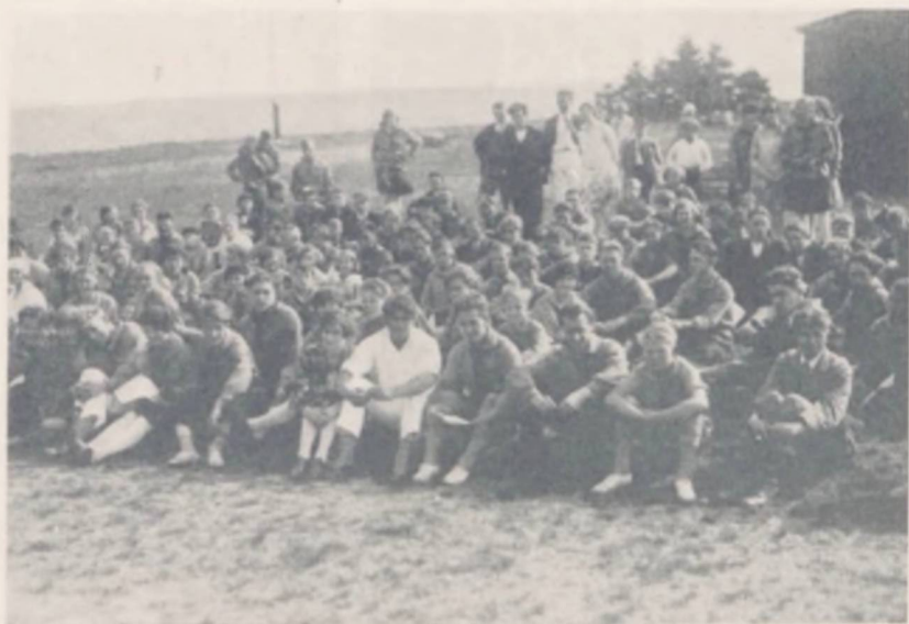
Periehjema-Kursus på Skæring Strand

efter lidt tillempedes det ny efter hjemlige Dimensioner og andre Forhold, og det blev D. s. U., som gik i Spidsen for en Højnelse af Møde- og Festkulturen her i Danmark.