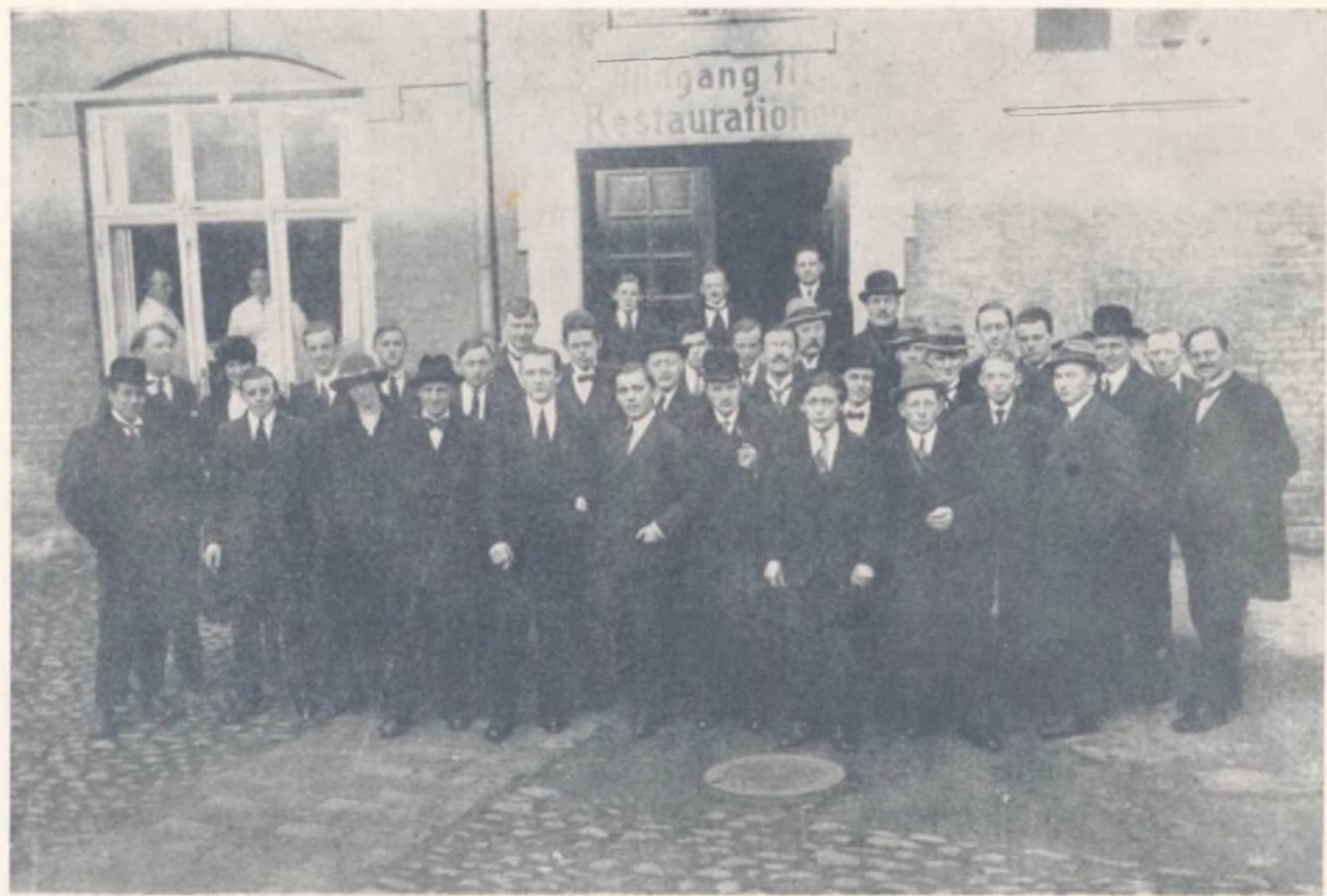
Deltagerne i Landsmødet i Aarhus 8. Februar 1920, da D. s. U. stiftedes