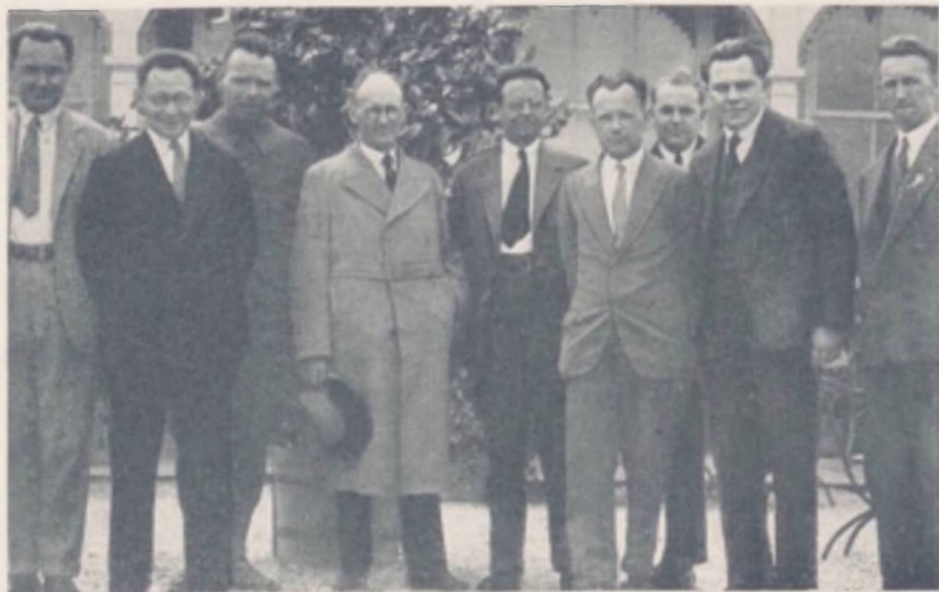
Medlemmerne af Ungdoms-Internationals Bureau sammen med nogle danske Gæster, København 1930