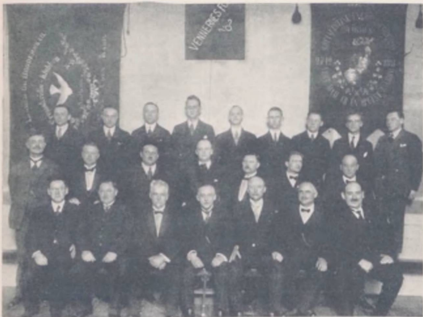
Formændene for Ungdomsforeningen i Aarhus i Tiden fra 1885 til 1927

R evolutionerne i Rusland 1917 og i Tyksland og Østrig- garn 1918 sammen med de øvrige Omvæltninger ude i Eu- ropa under og umiddelbart efter Verdenskrigen sendte stærke Donninger ogsaa ind over Danmark og lod ingen blive upaavir- kede, allermindst den politisk interesserede Arbejderungdom. Flertallet inden for S. U. F.'s Ledelse folte Begejstring for Bolschevikerne i Rusland og Spartakisterne i Tyskland — og dermed blev ikke blot Modsætningsforholdet til Partiet yder- ligere skærpet, men Brydningerne inden for selve S. U. F. traadte tydeligere frem og tiltog i Styrke.