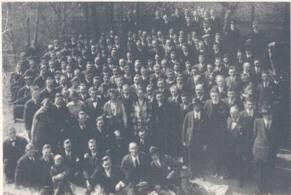
Deltagerne i Odense-Kongressen