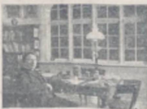
En af de mange unge, der er med i den nye Kamp om den sociale Sag i Danmark.

Vi Programmet, som er vort, er kun løst og løsningen berørt — er fra Løstende men fra Livs handle Side.