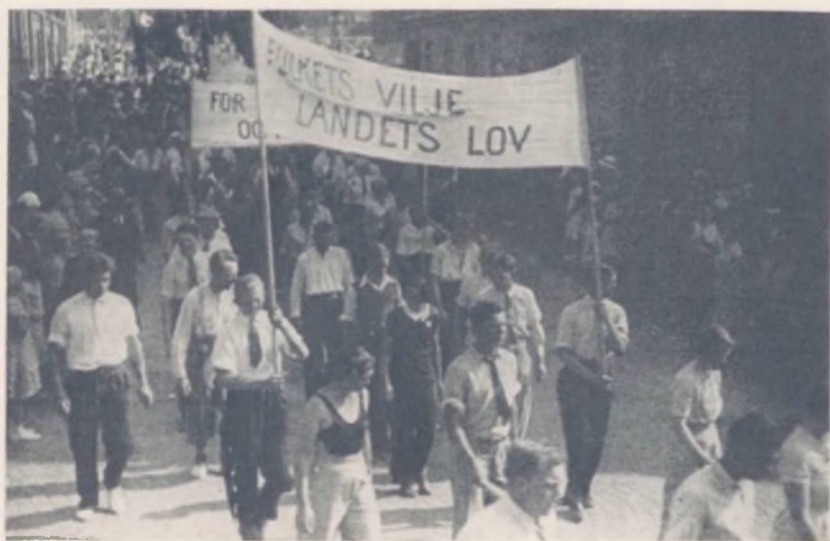
Ungdommens Bekendelse til Folketret

positive Resultater med Hensyn til Gennemførelsen af en Samfunds-skole for navnlig de 18-20-aarige, en Skole, der lægger Vægt saavel paa Ungdommens fysiske Opdragelse som paa dens Udvikling i Demokratiets Aand . Vi betragter dette Udvalgs Nedsættelse som Udtryk for, at den socialdemokratiske Ungdoms Ønske om en ny og omfattende Ungdoms-lovgivning vil blive opfyldt, og henviser her til vore i tidligere Udtalelser fremsatte Synspunkter. Over for Spørgsmaalet om denne Samfunds-skole er efter vor Opfattelse Problemstillingen Frihed eller Pligt ikke den rette. Afgørende maa være Hensynet til Ungdommens Udvikling i Folkestyrets Aand og Nødvendigheden af at opelske Ungdommens Forstaaelse af dens Samhørighed med Folkestyrets bærende Principper og humanistiske Udgangspunkt .