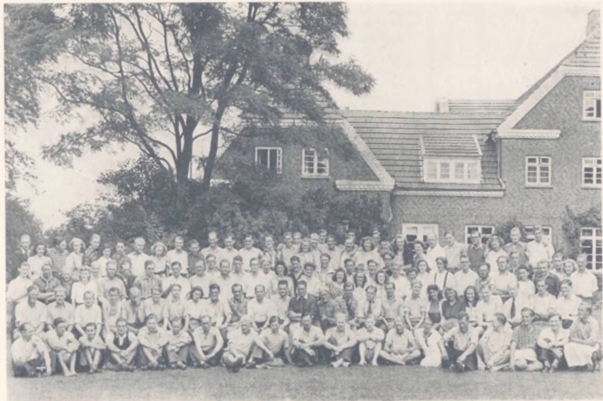
Landslederkursuset på Roskilde Højskole August 1944