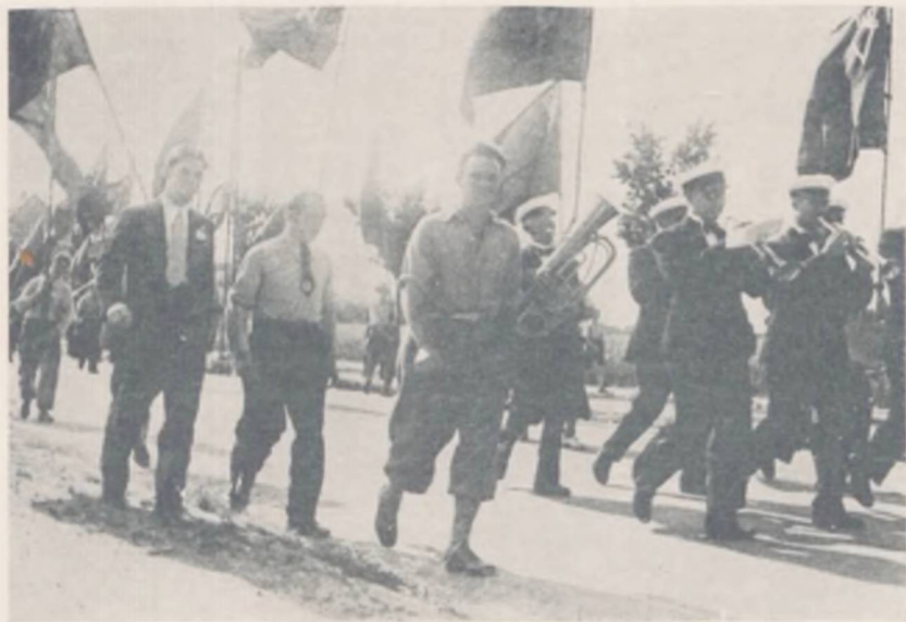
«Ud paa March, Kammerat!»

sin særlige Opgave, og paa Kongressen i 1937 forelaa Indstilling til en foreløbig Udtalelse om »Den unge Generation og Samfundet«. Denne Indstilling vedtoges, og Udvalget fortsatte sin Virksomhed og udarbejdede en Betænkning, der forelagdes paa Hovedbestyrelsens Møde i 1938. Betænkningen, der betegnedes som »et bredt social-politisk Arbejdsprogram«, indledes med følgende Betragtninger: