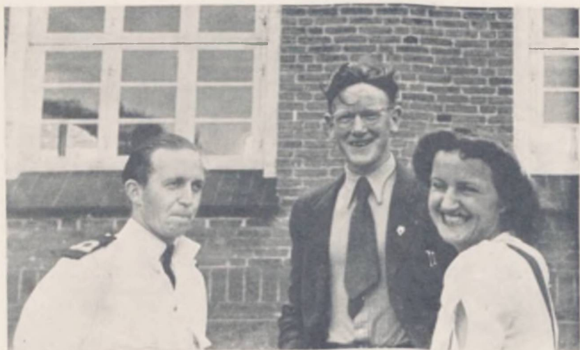
Officeren paa D. s. U.- Kursus har lige fortalt en god Historie

Venstres førende Mand, Indenrigsminister Jørgen Jørgensen , ved Afslutningen af et af Forsvarsministerens Foredragsudvalg og Værnenes Oplysningskontor foranstaltet Kursus for Befalingsmænd paa Frederiksberg Slot i Sommeren 1942 udtalte, at »Folk og Værn« har Mulighed for at udføre et Arbejde, som kan gøre det lettere til sin Tid at finde en fælles Løsning af Problemet ved vort Militærvæsen.