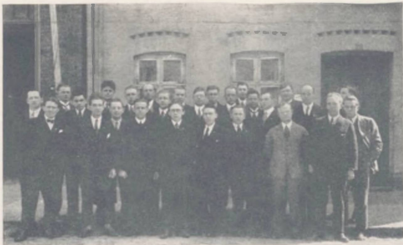
D. s. U. s Hovedbestyrelse 1927

dom kun havde betegnet en Episode. Da det kom til Stykket, stod Konservativ Ungdom paa Linje med D. s. U., Venstres Ungdom, Radikal Ungdom og Retsforbundets Ungdom, ligesom de fem demokratiske Partier fandt hverandre i et Samarbejde under Ledelse af Samlingsregeringen med Stauning i Spidsen.