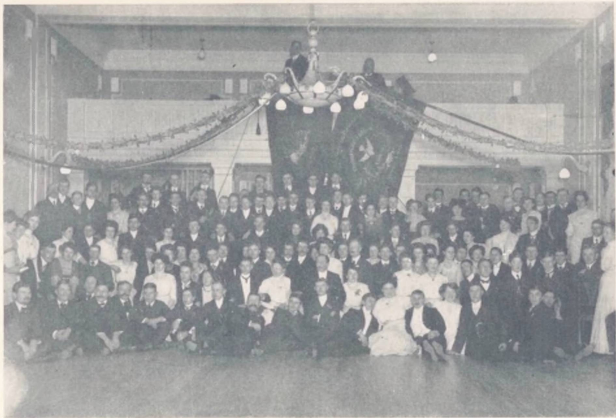
En Festaften i Fremskridtsklubben i Aarhus