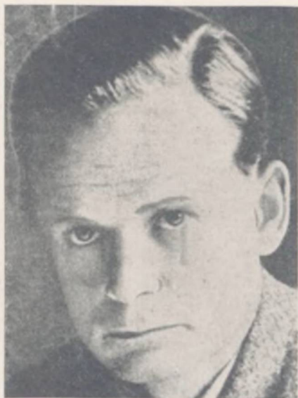
Hal Koch Professor, Dr. theol. Formand for Dansk Ungdomssamvirke

terede i Løbet af Oktober Maaned i en Omdannelse af D. U., saaledes at Samvirket kom til at omfatte selve Organisationerne, uden at der naturligvis blev Tale om en Sammenslutning af disse, og paa et Repræsentantskabsmøde den 31. Oktober 1940 valgtes Professor, Dr. theol. Hal Koch til Formand.