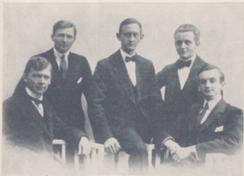
D. s. U. s første Sekretariat